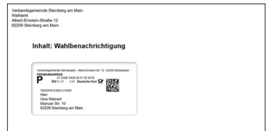
Gestaltungsbeispiel Briefhülle mit Fenster DIN lang