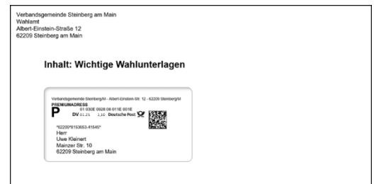
Gestaltungsbeispiel Briefhülle mit Fenster DIN lang